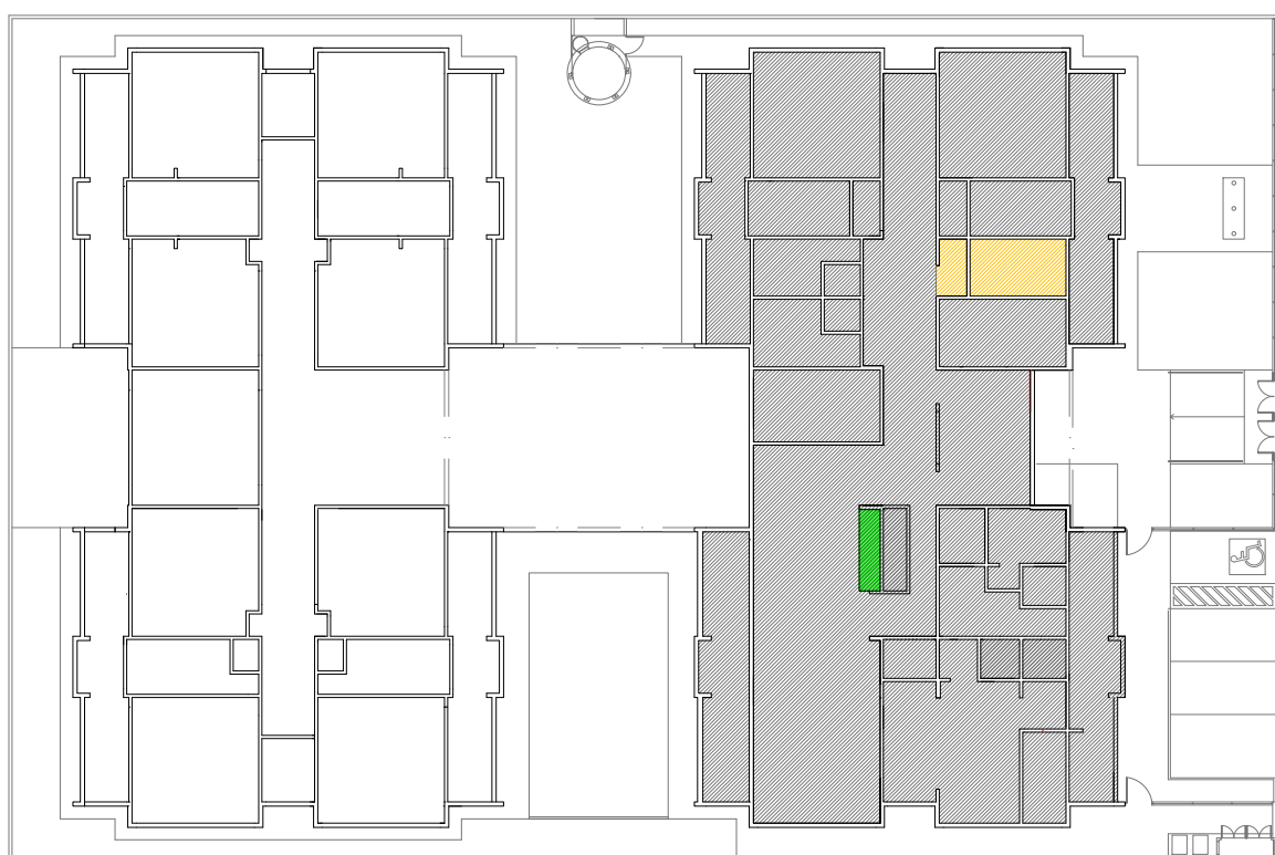
CROQUI DE REFERÊNCIA