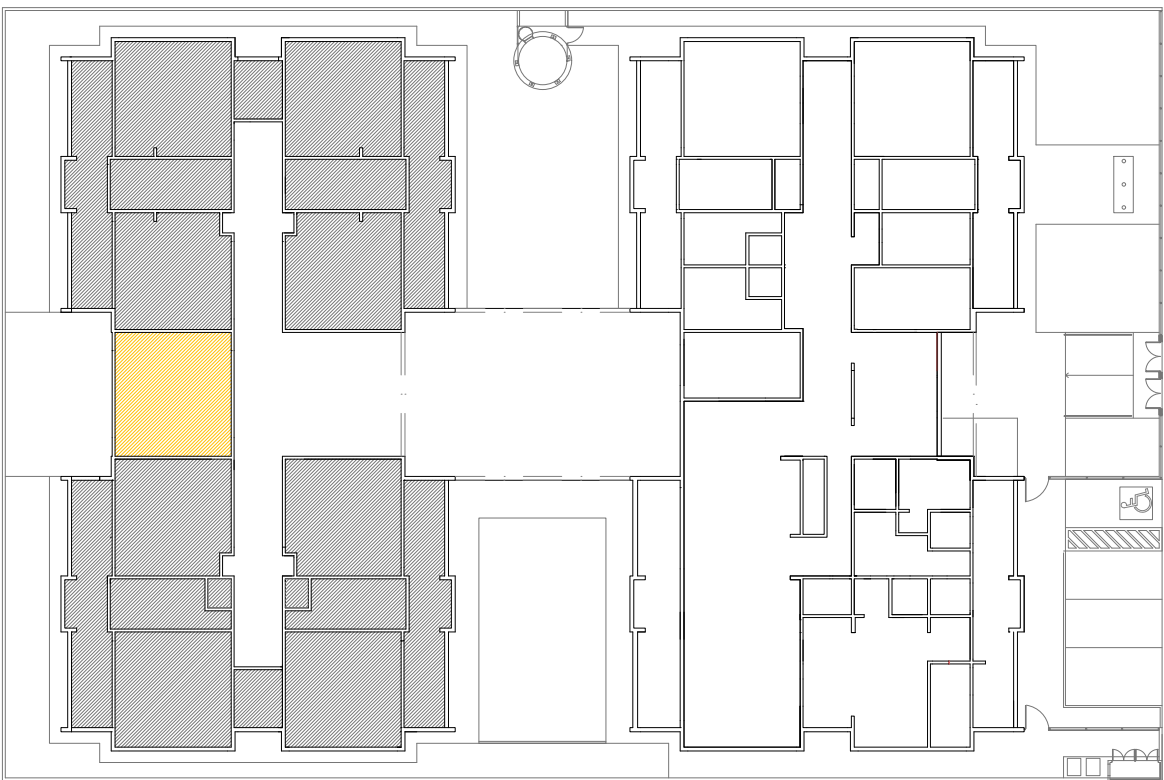
CROQUI DE REFERÊNCIA