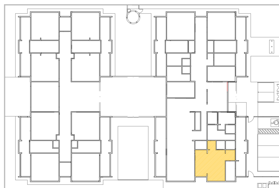
CROQUI DE REFERÊNCIA