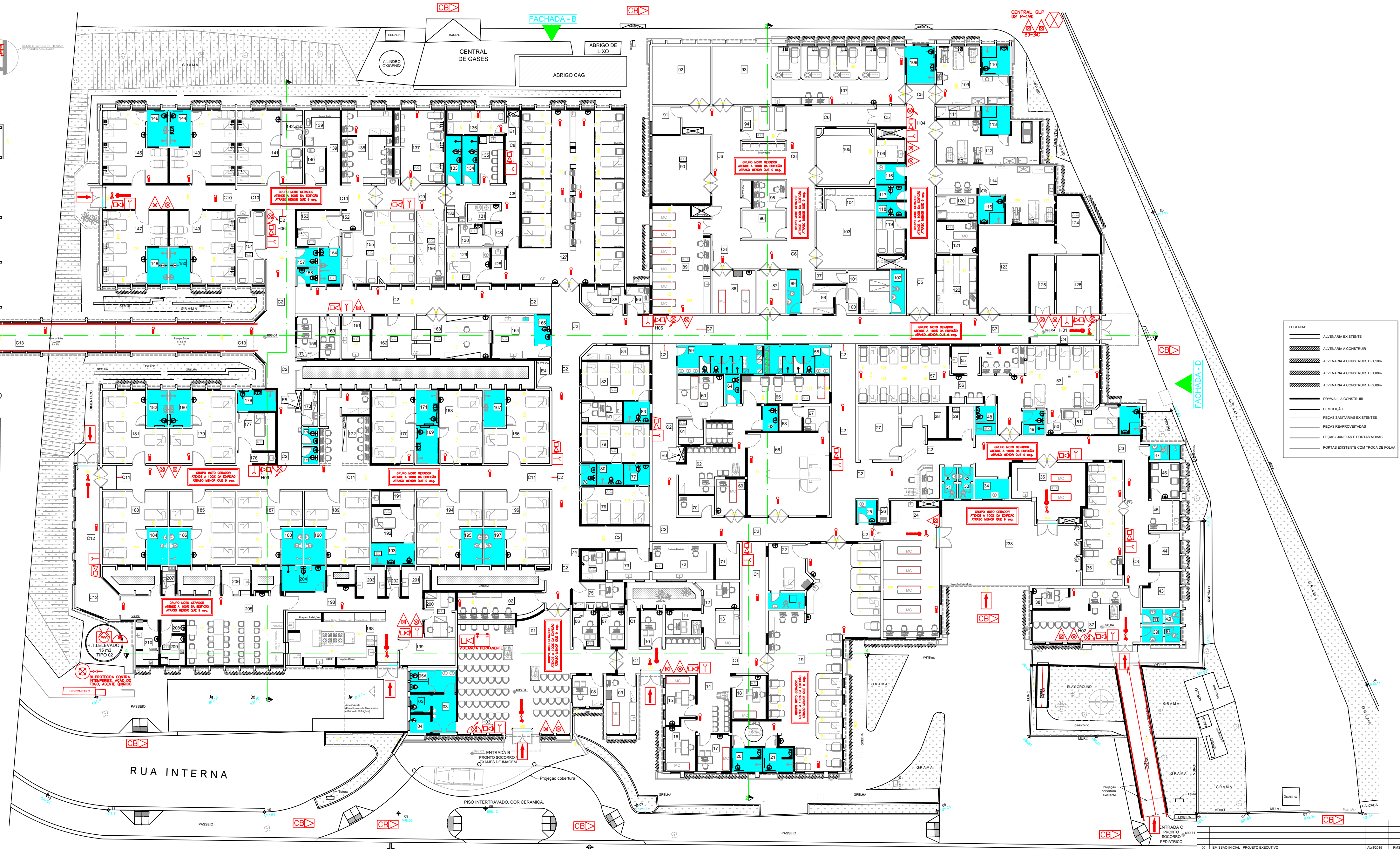
PLANTA TÉRREO - NÍVEL 698,04 ESCALA: 1:100