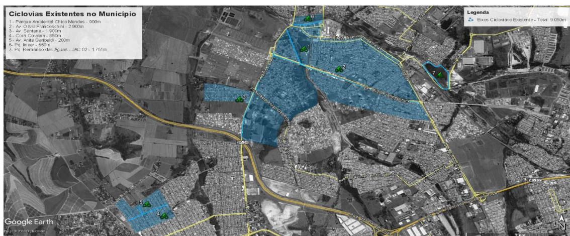
Ciclovias existentes no município

O Projeto foi concebido de forma, que a nova rede cicloviária tenha uma conexão com a ciclovia existente, hoje com aproximadamente 9,05 km, de forma que, interfira o mínimo possível no viário. Para tanto foram considerados como critério: hierarquia viária, dimensionamento da pista, número de faixas de rolamento por viário, circulação de tráfego, velocidade regulamentada e política de estacionamentos por via e deslocamento de pedestres e ciclistas.