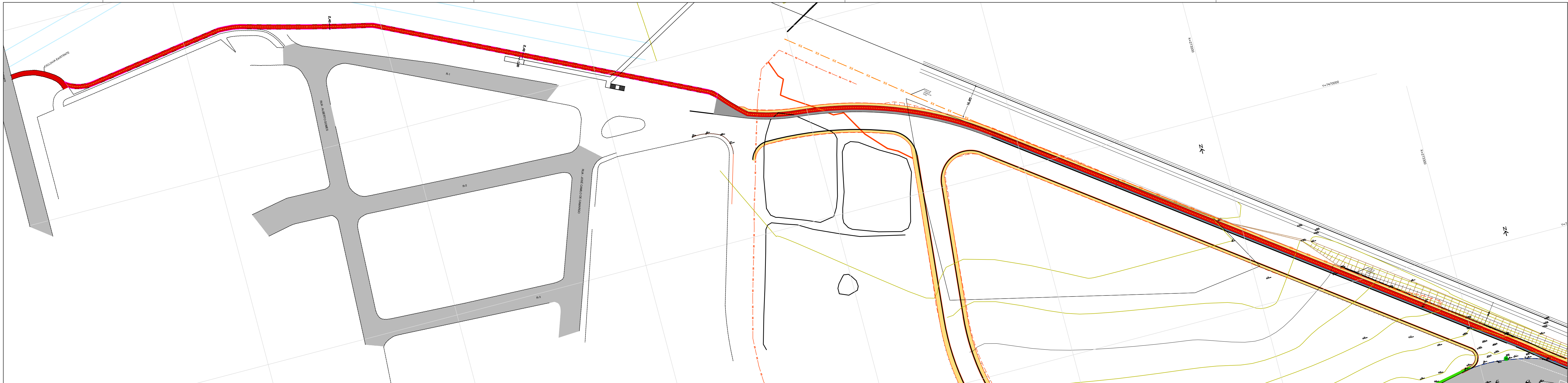
1 PLANTA ESCALA 1:1000