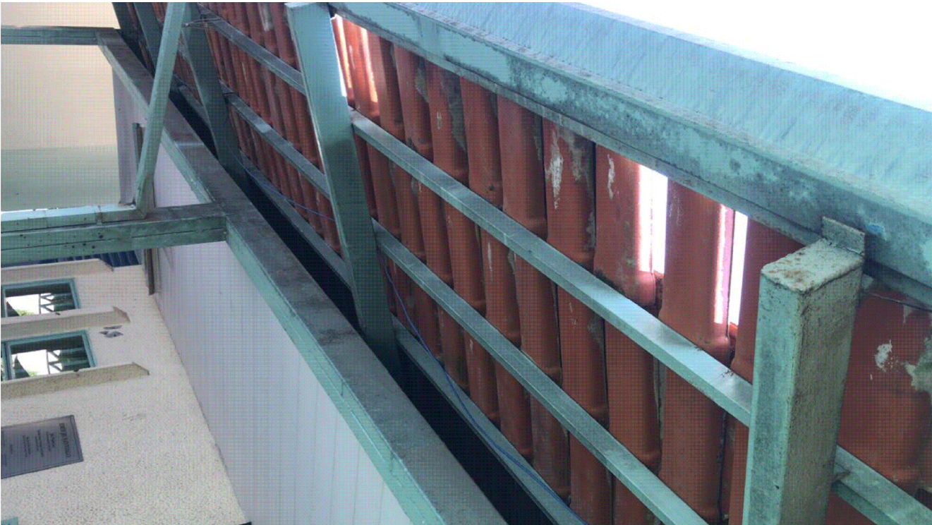
IMAGENS DO LOCAL