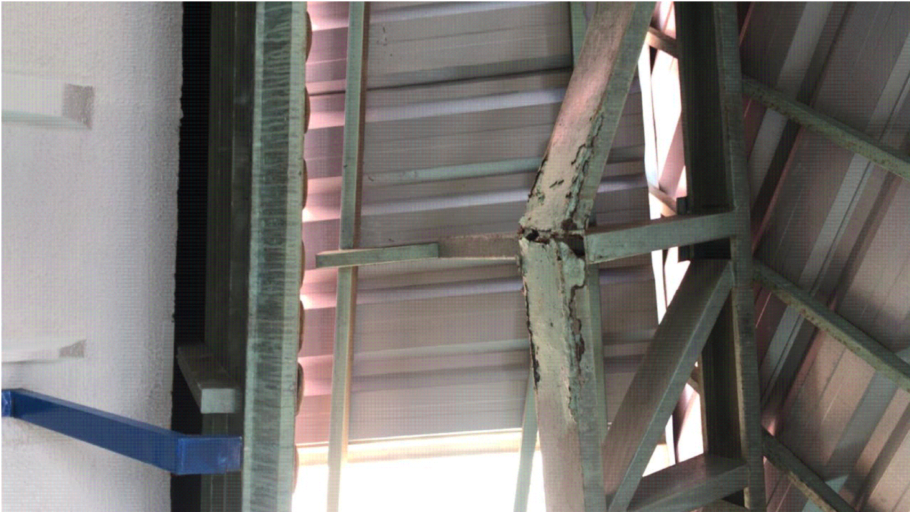
IMAGENS DO LOCAL