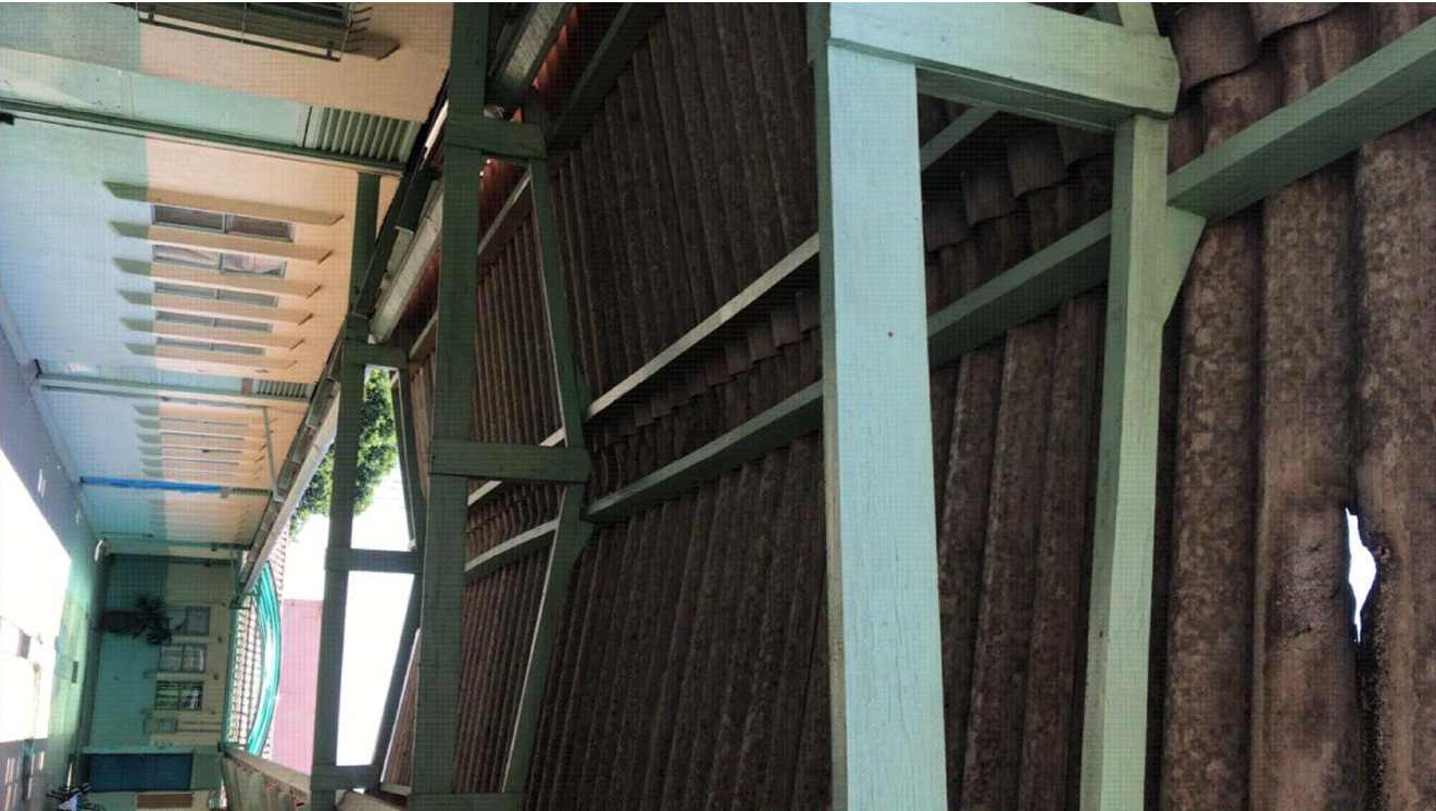
IMAGENS DO LOCAL