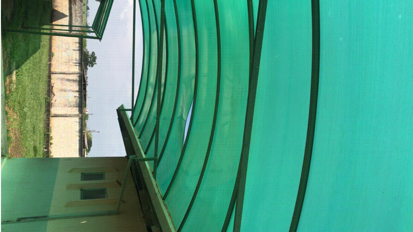
IMAGENS DO LOCAL