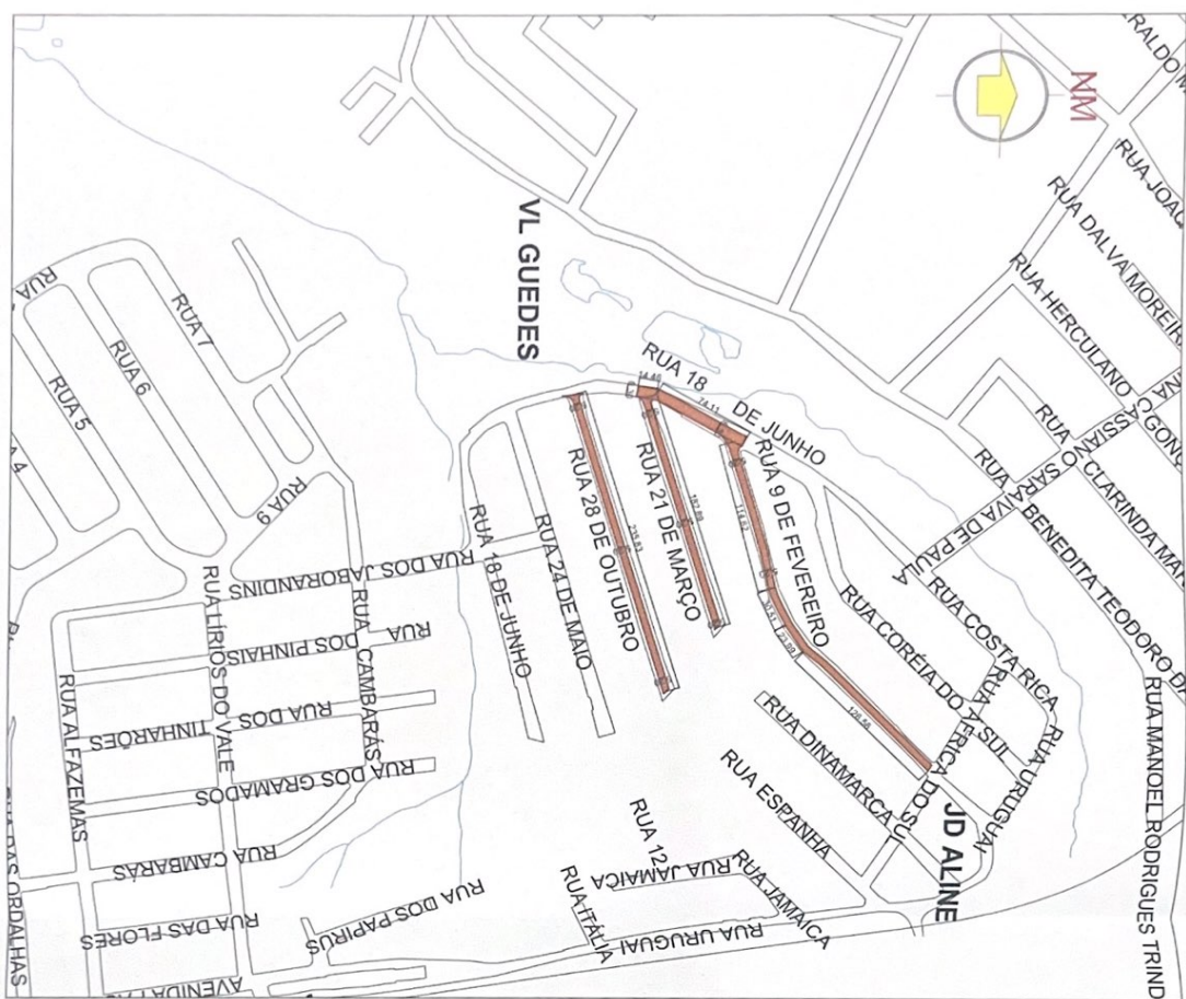
PLANTA GERAL DAS RUAS A SEREM RECALÇADAS Escala: 1:2.000