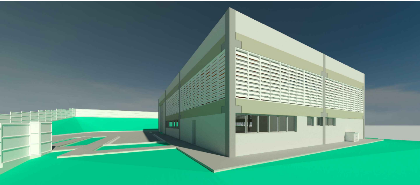
3 Vista 3D 1 : 5